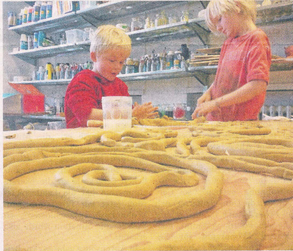
Nicht nur mit Farben, auch mit Materialien wurde gearbeitet.